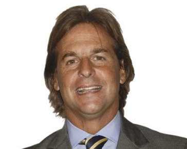
Lacalle Pou, Luis Alberto