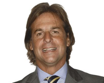
Lacalle Pou, Luis Alberto