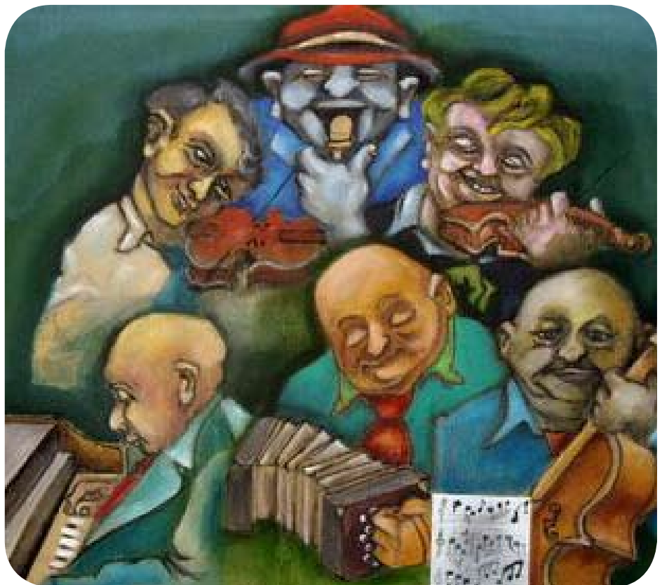
"Sexteto Tanguero" óleo sobre tela de R. Saban