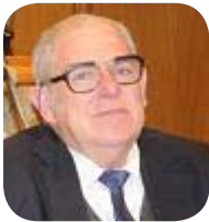
Néstor López Edil de Rivera, Vicepresidente del Congreso de Ediles

Estamos tendiendo las manos y los puentes para que los jóvenes se integren. Por eso hoy arengaba a los jóvenes para que peleen su lugar, porque si lo pelean lo consiguen. Muchos jóvenes vinieron desde muy lejos, quiere decir que el interés está en los jóvenes. Expusieron muy bien sus problemas y va a ser nuestro trabajo como legisladores tender los puentes. Me voy con la inquietud de formar una comisión específica del tema juvenil en la Junta, para que el joven tenga las herramientas para llegar mejor.